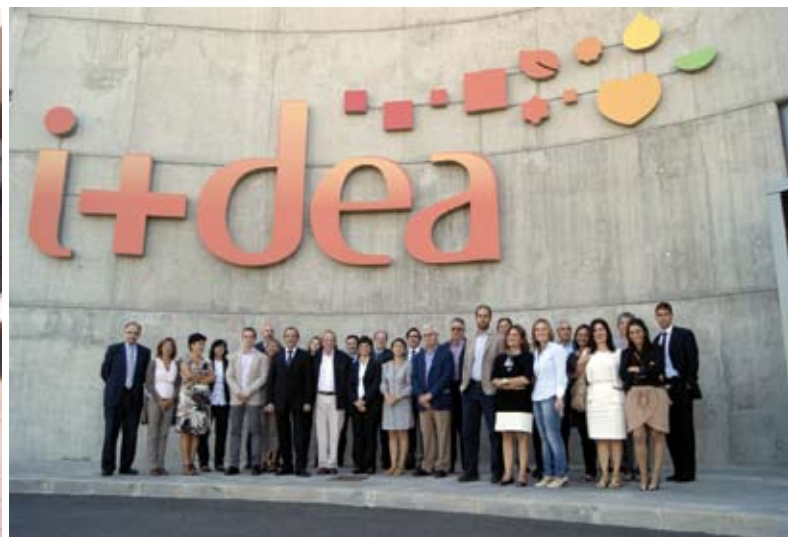
Foto del Consorcio 2011. Reunión Justificación. Final 2011.