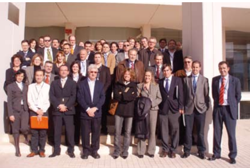
Consorcio Acuisost. Reunión Inaugural. 2007

Finalmente, es necesario comentar que la Facultad de Ciencias Económicas y Empresariales de la Universidad de Valladolid está desarrollando una Tesis Doctoral con el Proyecto Acuisost como modelo y ejemplo de alianzas estratégicas multisocio. ■